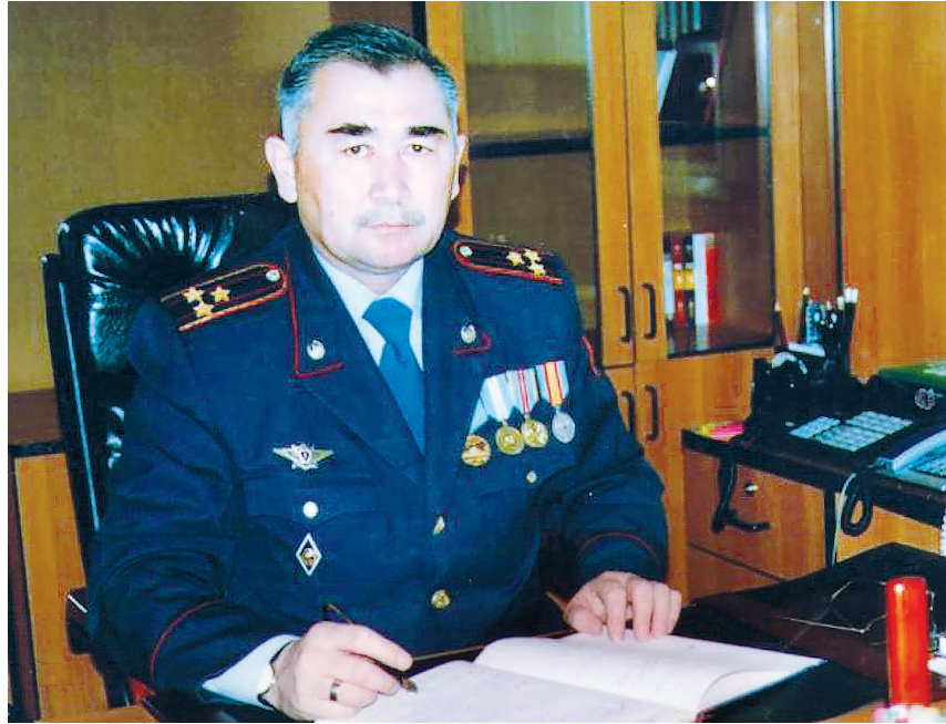
граждан, а также в привлечении населения в дело обеспечения правопорядка и улучшения криминогенной обстановки в стране.

Когда я с должности директора Международного радио Гостелерадио пришел начальником пресс-центра Министерства внутренних дел, пресс-служба была в составе штаба. Далее, при непосредственной поддержке тогдашнего министра генерала-полковника Каирбека Сулейменова мы провели большую работу по отделению пресс-службы из состава штаба. В результате чего в 1995 году пресс-служба стала самостоятельной структурой. Цель этой инициативы заключалась в пропаганде службы полицейских, которые в любое время суток, несмотря ни на что, стоят на защите законных интересов