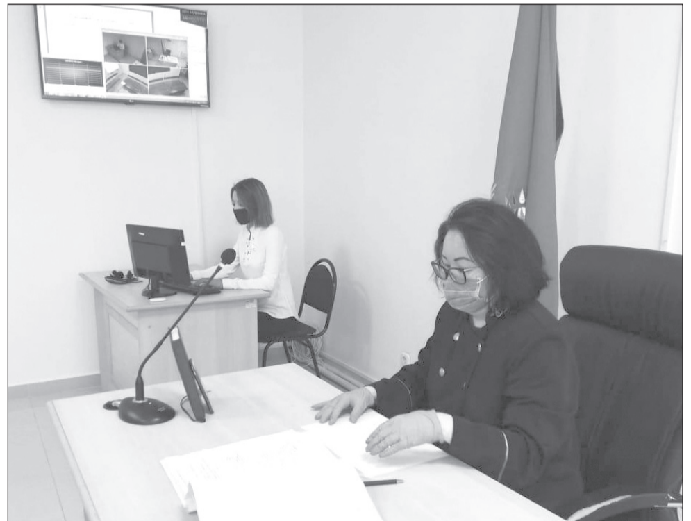
В течение максимально короткого времени суды Казахстана перешли фактически на цифровой формат рассмотрения дел без приглашения и вызова сторон в залы судебных заседаний

ние режима чрезвычайного положения». Ежедневный анализ судебной практики свидетельствует о том, что если в первый