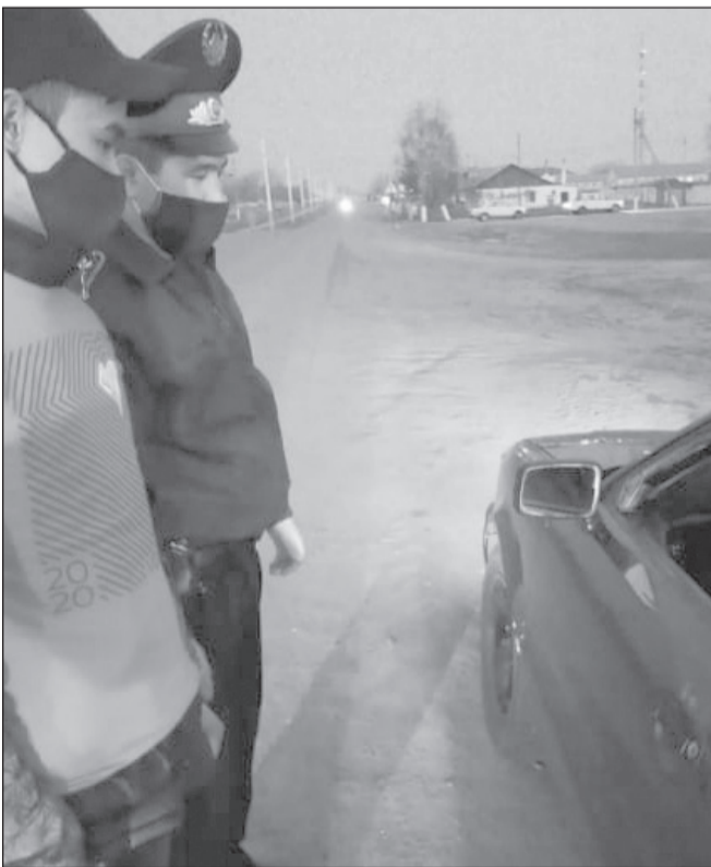
Аманкелді ауданының тәртіп сақшылары кешкі рейдте

Полиция қызметкерлері жұртты карантин кезінде елде бекітілген талаптарды сақтап, тәртіпке бағынуға шақырады. Карантин режимін бұзғандар ҚР Әкімшілік құқық бұзушылық туралы кодексінің 476-бабы бойынша, 10 АЕК айыппұл немесе 15 тәулікке дейін қамауға алынатынын хабарлайды.