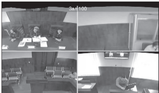
В условиях режима ЧП судами стали использоваться сервисы WhatsApp, Instagram, Zoom и другие

даний, в апреле 2020 года эта цифра возросла до 2 000 процессов в день.