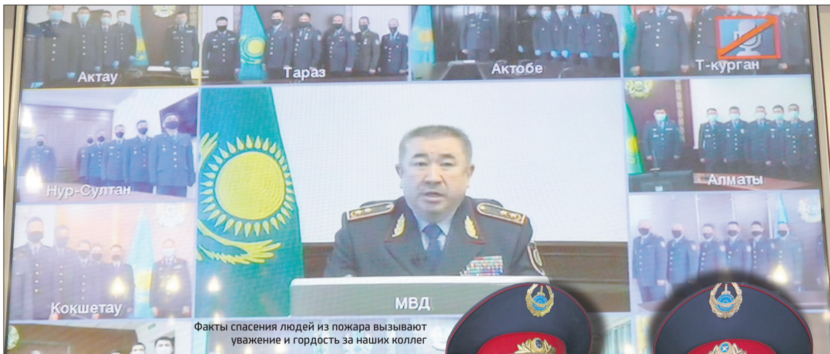
Факты спасения людей из пожара вызывают уважение и гордость за наших коллег

- Сотрудники органов внутренних дел в этот непростой период работают в особом режиме, зачастую подвергая риску свое здоровье. Они и сейчас продолжают достойно нести службу на улицах населенных пунктов и дорогах нашей страны, обеспечивая должную охрану общественного порядка, безопасность, спокойствие и здоровье граждан. Полицейские