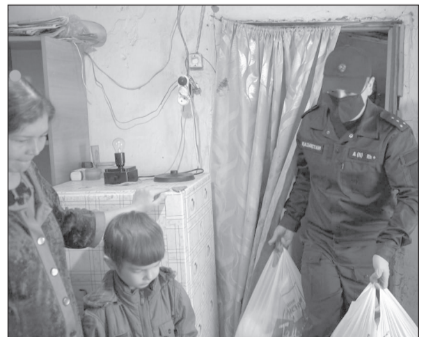
Көп бала тәрбиелеп отырған Әлия көрсетілген көмекке алғысын айтты

Тәртіп сақшылары мұндай акцияны алдағы уақытта да өткізуді жоспарлап отыр.