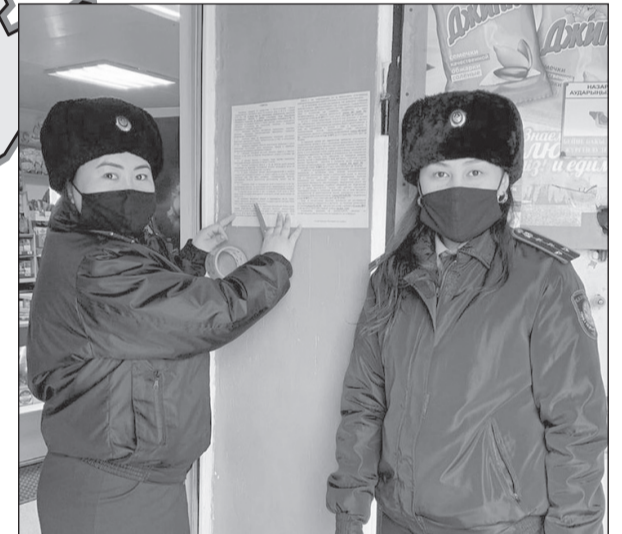
Ескерту ұнарақтары жапсырылды

Сондай-ақ сауда орындарының сатушыларымен және иелерімен заңды қадағалау жөнінде алдын алу әңгімелері жүргізілді.