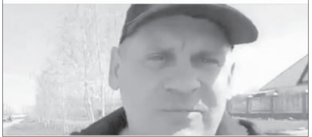
Сразу несколько видеообращений записали фермеры, в которых отметили слаженную работу полиции, акиматов районов по организации пропускной работы