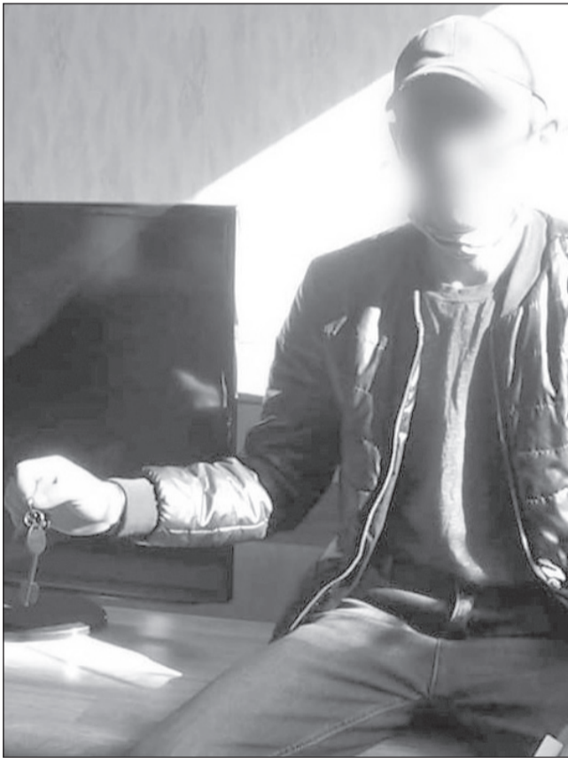
Задержан 21-летний подозреваемый, житель Жангельдинского района, ранее не судимый