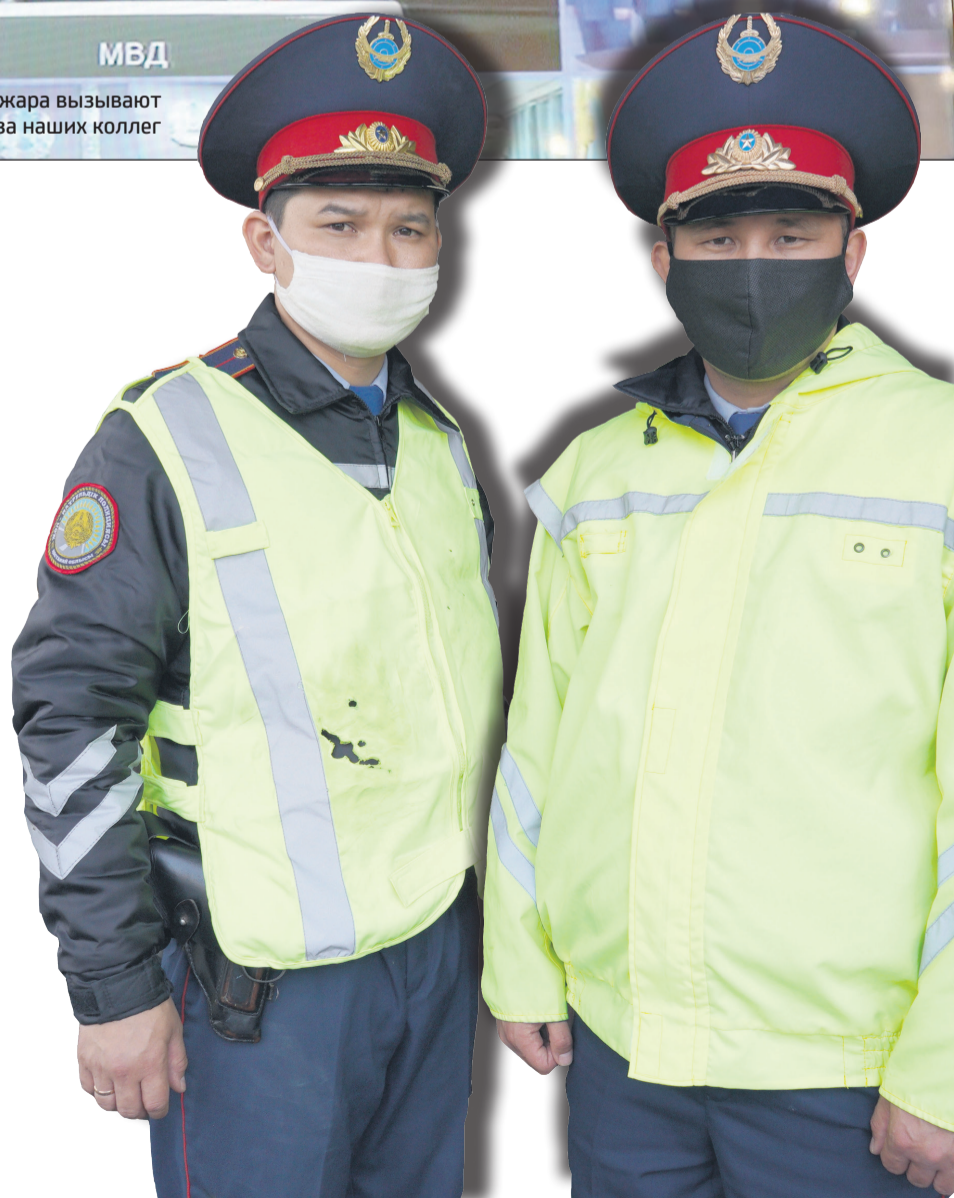
На полицейских горела форма, они получили ожоги рук