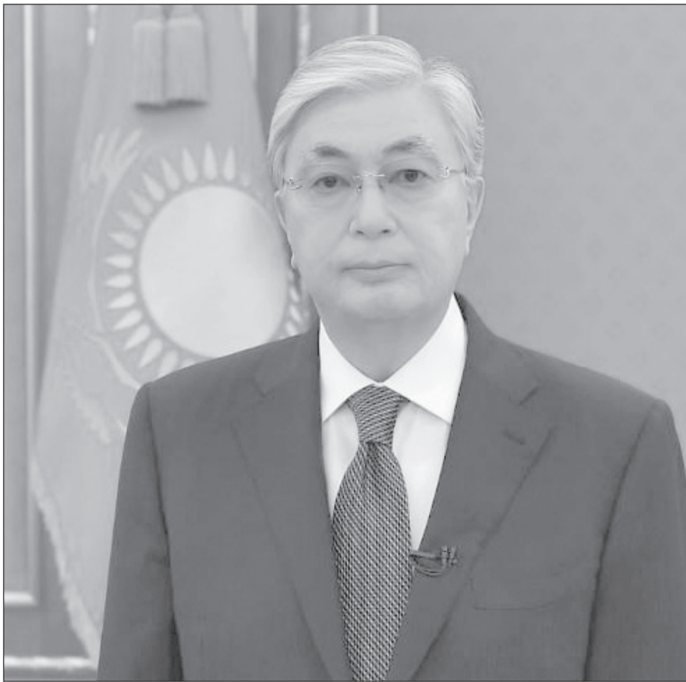
Действия Казахстана получили положительные отзывы Всемирной организации здравоохранения и международных экспертов

находятся на передовой борьбы с пандемией. Минздрав и акимы принимают меры по поддержке других категорий медицинских работников. Более 1,6 миллиона граждан и 11,5 тысячи субъектов МСБ получили отсрочку по выплатам займов и кредитов на общую сумму более 360 миллиардов тенге. Малый и средний бизнес сегодня находится в сложном положении. Если мы сегодня не поможем ему выстоять, о восстановлении экономики страны не может быть и речи. Мерами налогового стимулирования охвачено более 700 тысяч компаний и индивидуальных предпринимателей, что позволит им сэкономить около одного триллиона тенге. Выделены средства для кредитования малого и среднего бизнеса по приемлемым ставкам. Чтобы избежать сокращений людей и их зарплат, формируется Реестр системообразующих компаний, которым будет оказана соответствующая поддержка. В него должны войти действительно важные для нашей экономики компании. Несмотря на все сложности, продолжают работать аграрии. Их труд заслуживает искреннего уважения. Вопросы проведения весенне-полевых работ в основном решены. Никаких препятствий здесь не должно быть. Это задача Министрства сельского хозяйства и акимов. 200 миллиардов тенге направлены на финансирование весенне-полевых работ и форвардный закуп, в том числе 70 миллиардов выделены на развитие семейного производства, приобретение удобрений и пестицидов. В целом объем средств, направленных на поддержку граждан и бизнеса, составил почти шесть триллионов тенге. Это, как вы понимаете, огромная сумма. Задача