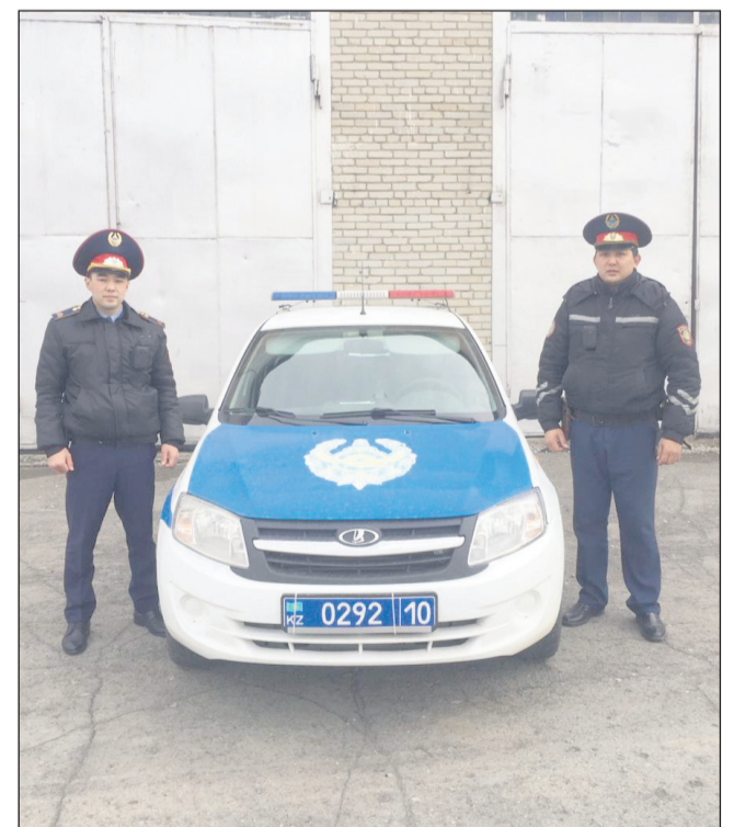
Полицейские в режиме ЧП ни на минуту не отпускают руку с городского пульса жизни

- Ко мне поступил сигнал тревоги с объекта ТЦ. Сразу же об этом я сообщил дежурному отделу полиции. Наряд на место происшествия прибыл за четыре минуты. Поли-