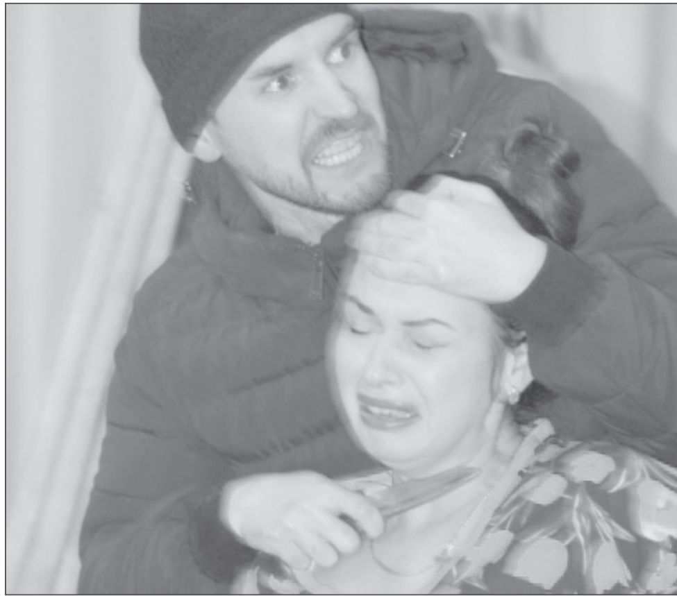
Кадр из спектакля