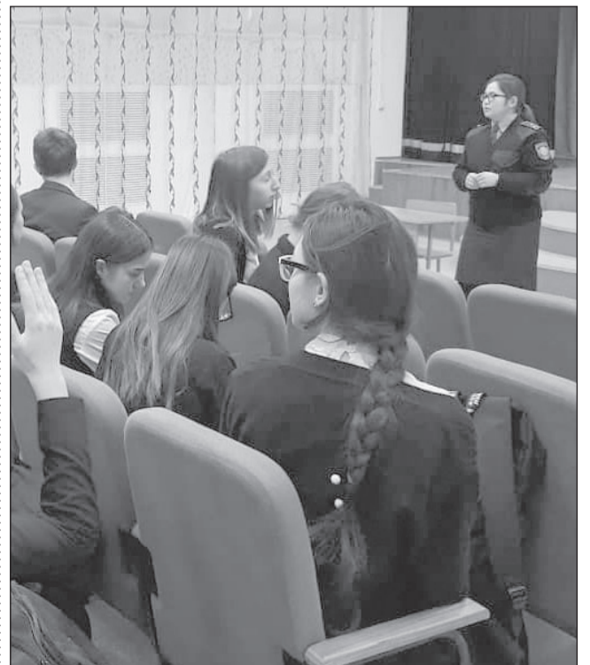
Ұзынкөл ауданының оқушыларымен кездесу

Кездесуде оқушылар өздерінің көкейлерінде жүрген сауалдарына нақты жауап алды.