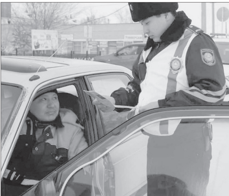
Көлік жүргізушілерін тексеру басталды

-Мысалы, бұған дейін облыс орталығында, яғни Қостанай