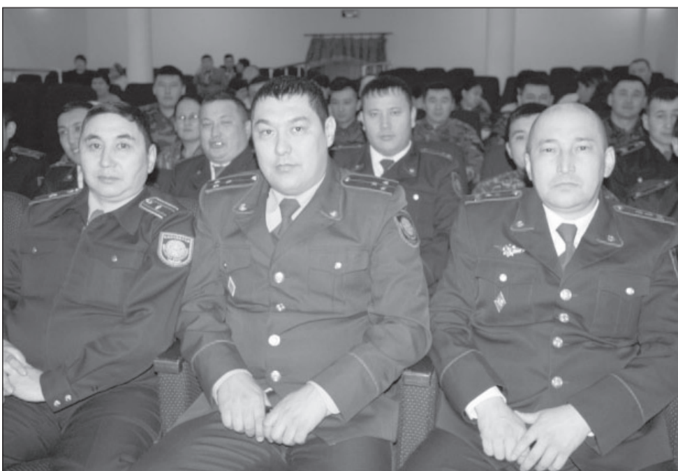
Первыми увидели спектакль сотрудники Амангельдинского отдела полиции

ательствах, которые далеки от привычной профессиональной сцены драматического театра в буквальном смысле. Для этого надо было сесть с артистами в автобус