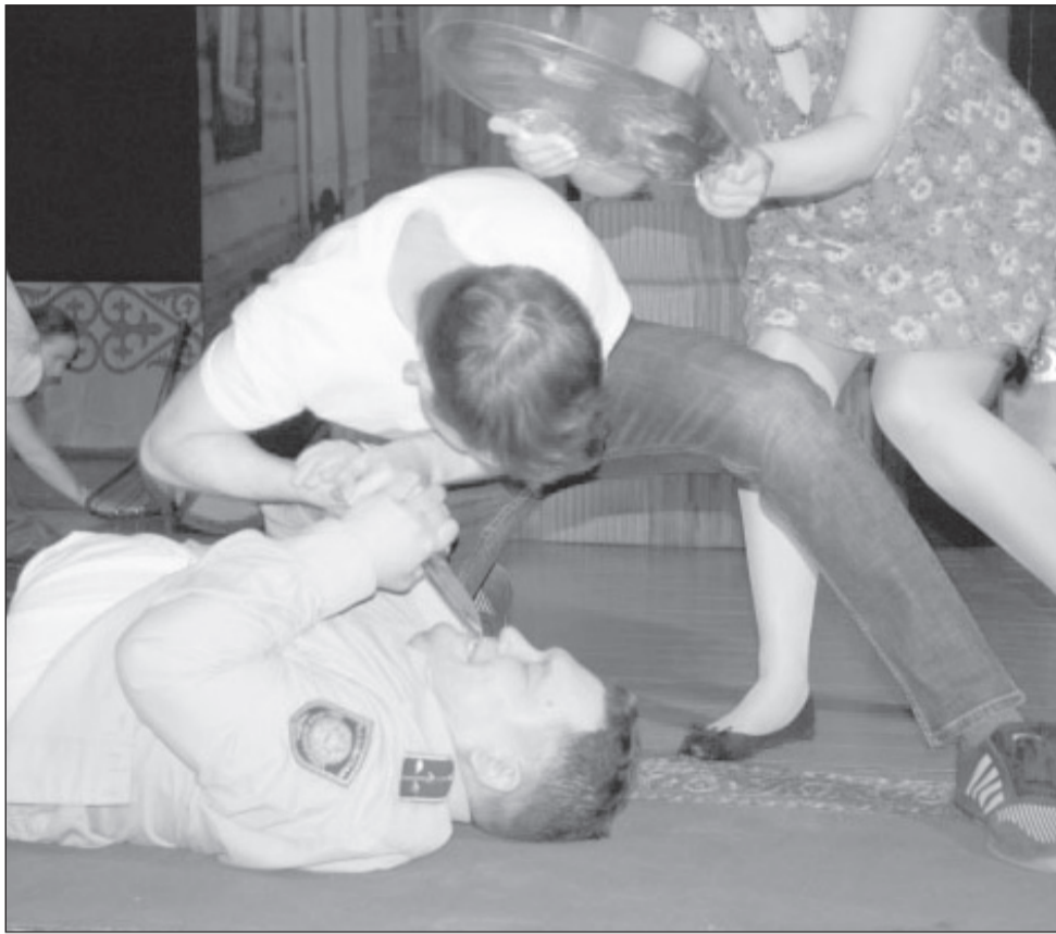
События на сцене

Спектакль под таким названием увидели жители глубинки