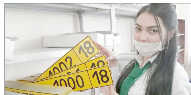
В область поступило 100 иностранных номеров