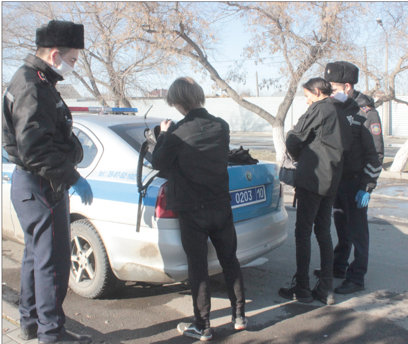
Убегающих удалось поймать и досмотреть

Впрочем, преемственность поколений - явление в правоохранительных органах довольно частое. По стопам своих отцов идут многие. В полиции сегодня служат более 114 сотру-