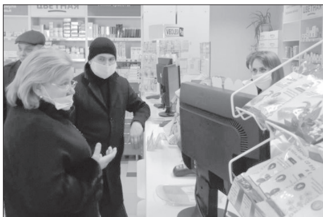
Ежедневно 40 бригад проводят рейдовые мероприятия в области

Выявление контактных лиц, дежурства на границе и наблюдение за теми, кого уже отправили на карантин, - это лишь часть их ежедневной работы. Несмотря на семью, которые их ждут дома, десятки опытных специалистов Департамента