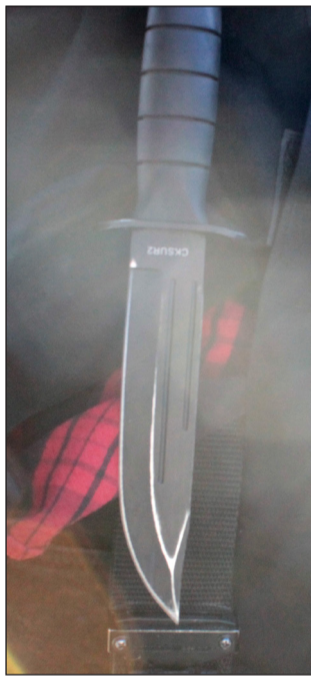
В ходе осмотра полицейские обнаружили противогаз, сигареты и подозрительных размеров нож