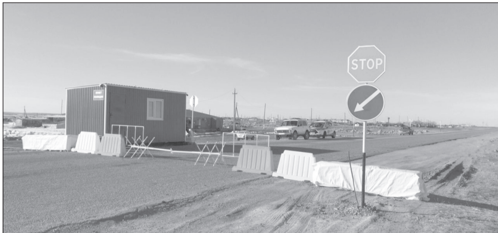
Один из блокпостов расположен на трассе республиканского значения А-22 «Карабутак-Костанай» на 239 километре в районе поселка Жайылма Камыстинского района

Они выставлены для предупреждения распространения коронавируса