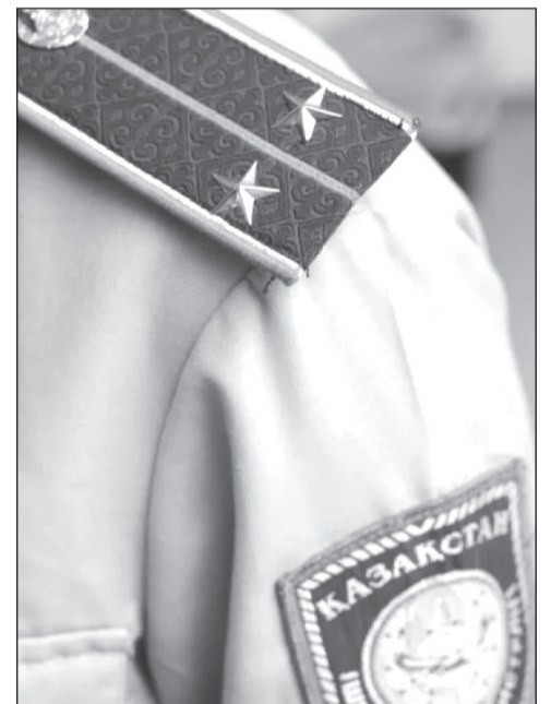
Қостанай облысында ТЖ кезеңінде жалған ақпарат таратқан 5 адам анықталды

–Бүгіндері ғимаратта және келіп-кетушілер арасында тазалықты сақтау, осында уақытша ұсталған азаматтарға түсіндіру жұмыстары жүріп жатыр, - деді Нұрлан Нүрекин.