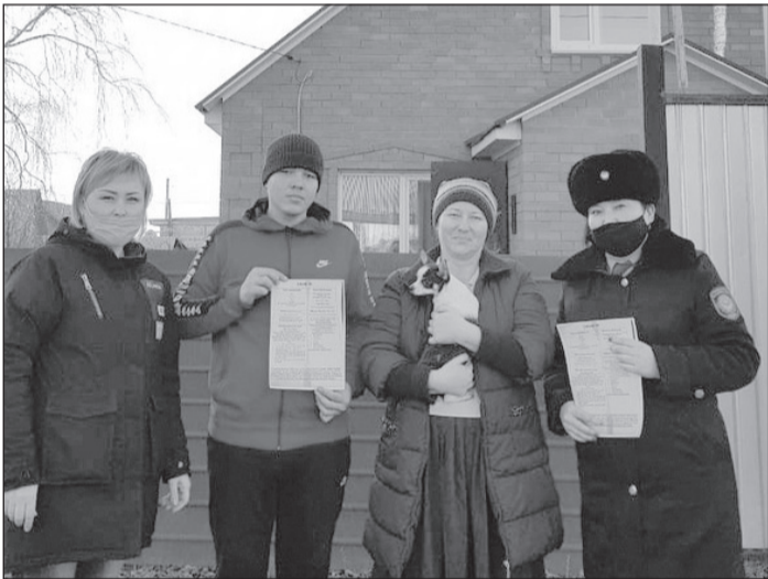
Ата-аналар мен оқушылар оқшаулау ережесімен танысты

Ескерте кетейік, Қостанай облысы аумағында коронавирус жұқтырған оқиға тіркелмеді.