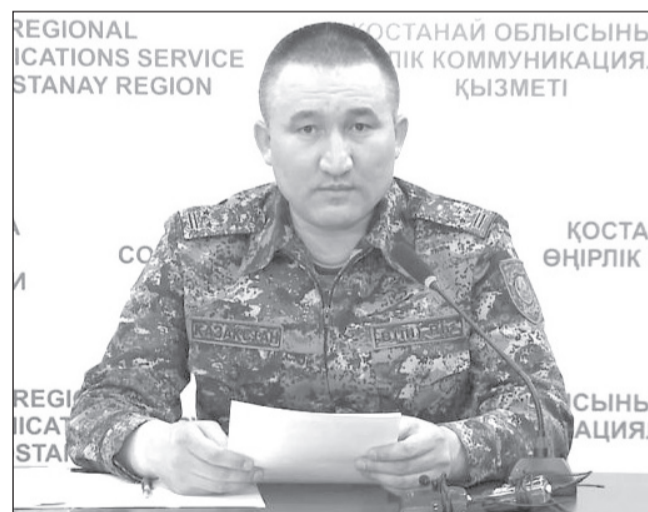
Дежурство на блокпостах будет круглосуточным

- блокпост №7 - на автодороге Екатеринбург-Алматы, на 374 км, на пограничном посту «Кайрак»; - блокпост №8 - на 180 км на автодороге Костанай-Курган, на пограничном посту «Убаган»; - блокпост №9 - автодорога Костанай-Мамлютка, 245 км,