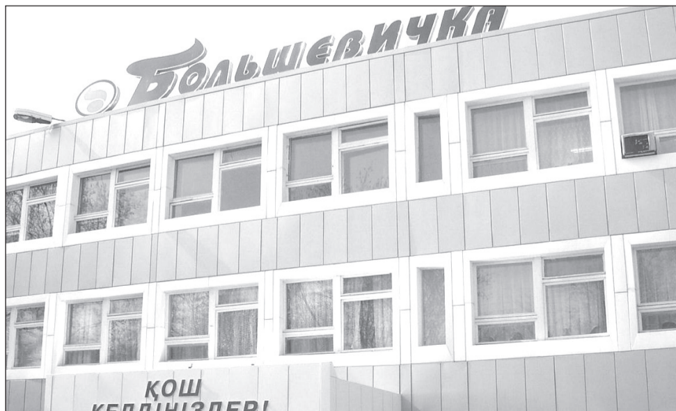
На первое место мы ставим качество продукции

Одними из первых мы обеспечили масочной продукцией сотрудников поли-