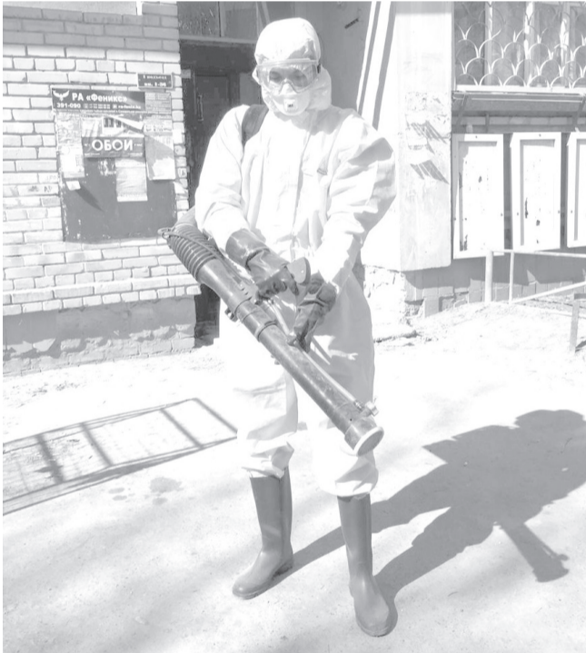
Средство, которое используется, безопасно для жителей, но смертельно для вируса