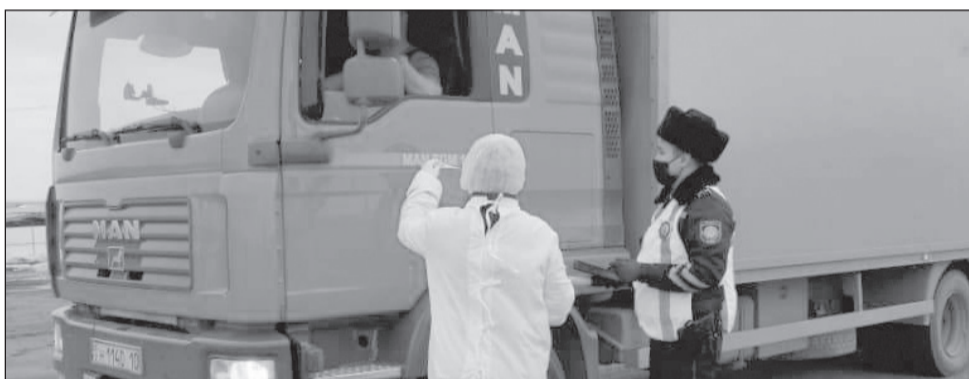
На блокпостах началась работа по проверке автотранспорта