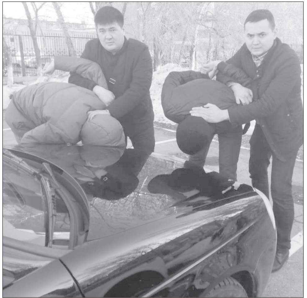
С автомашин были сняты отпечатки пальцев, которые принадлежат задержанным

— Они бросили угнанные машины в городе Тобыле в глухих переулках. У одной машины спустило колесо, у второй случилась поломка двигателя. Машины они планировали отбуксировать к себе в поселок и затем