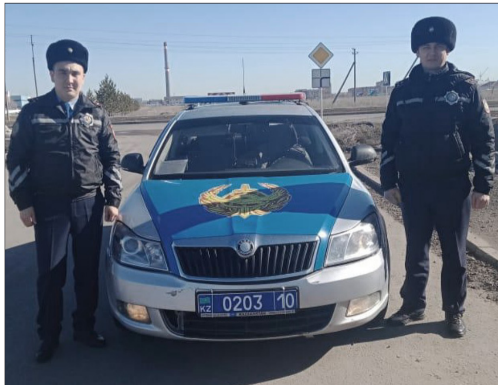
В условиях многозадачности сотрудники полиции справляются

ников, которые продолжают семейные династии.