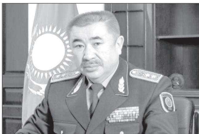
Обращаясь к жителям нашей страны, хочу сказать, что каждый из нас должен сегодня осознать серьезность ситуации, проявить сознательность и терпение

Напомним, что в Нур-Султане и Алматы ввели карантин. А с 28 марта вступили в силу новые ограничения. Так, горожанам нельзя выходить на улицу без особой необ-