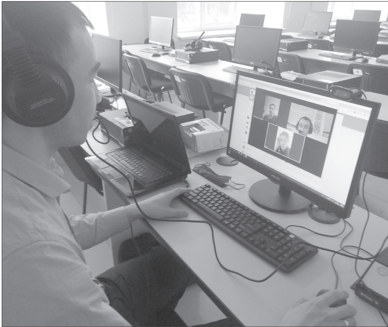
Қашықтықтан оқыту сәтінен көрініс

Біліктілікті арттыру және қайта даярлау факультеті компьютерлік және ақпараттық технологияларды қолда-