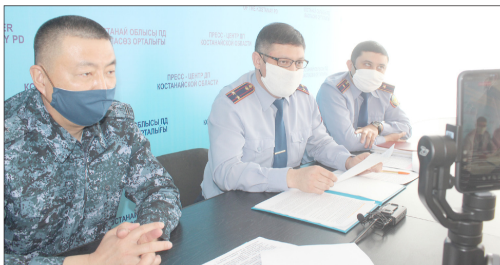
Уже со 2 апреля 2020 года жителям области нельзя будет находиться без масок в автобусах. Также при передвижении в такси необходимо соблюдать масочный режим и передвигаться не более двух человек в одной машине