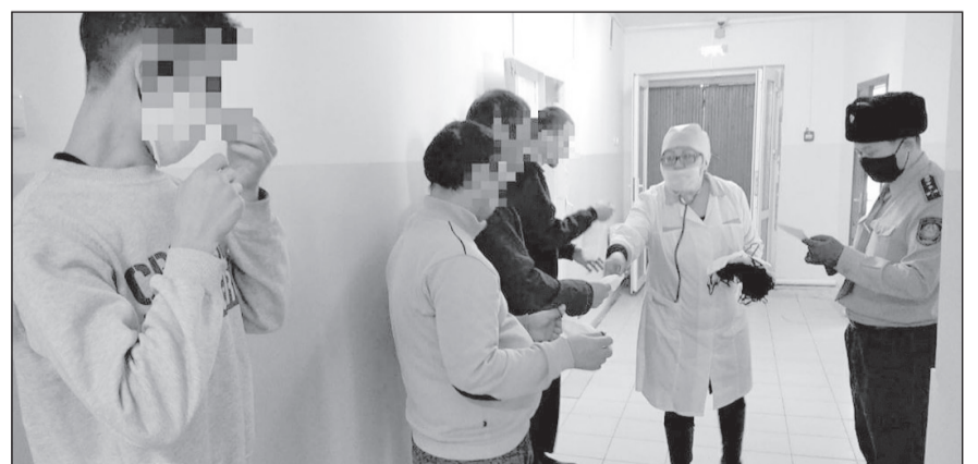
Әкімшілік жауапкершілікке тартылғандар да назардан тыс қалмады

Тауарлар және көрсетілетін қызметтердің сапасы мен қауіпсіздігін бақылау департаменті берген мәлімет бойынша, Арқалықта коронавирус жұқтырғандар жоқ. Кеше Арқалық пен Жітіқарада екі адам госпитальға жатқызылған. Оның біреуі - ер адам, екіншісі - әйел. Олардың Ақмола облысында коронавирустан қаза тапқан әйелмен бір пойызда отырғаны анықталған. Екеуінен қан алынып, талдау қорытындысы теріс нәтиже көрсеткен. Екеуі де карантин аяқталғанша дәрігерлердің бақылауында болады.