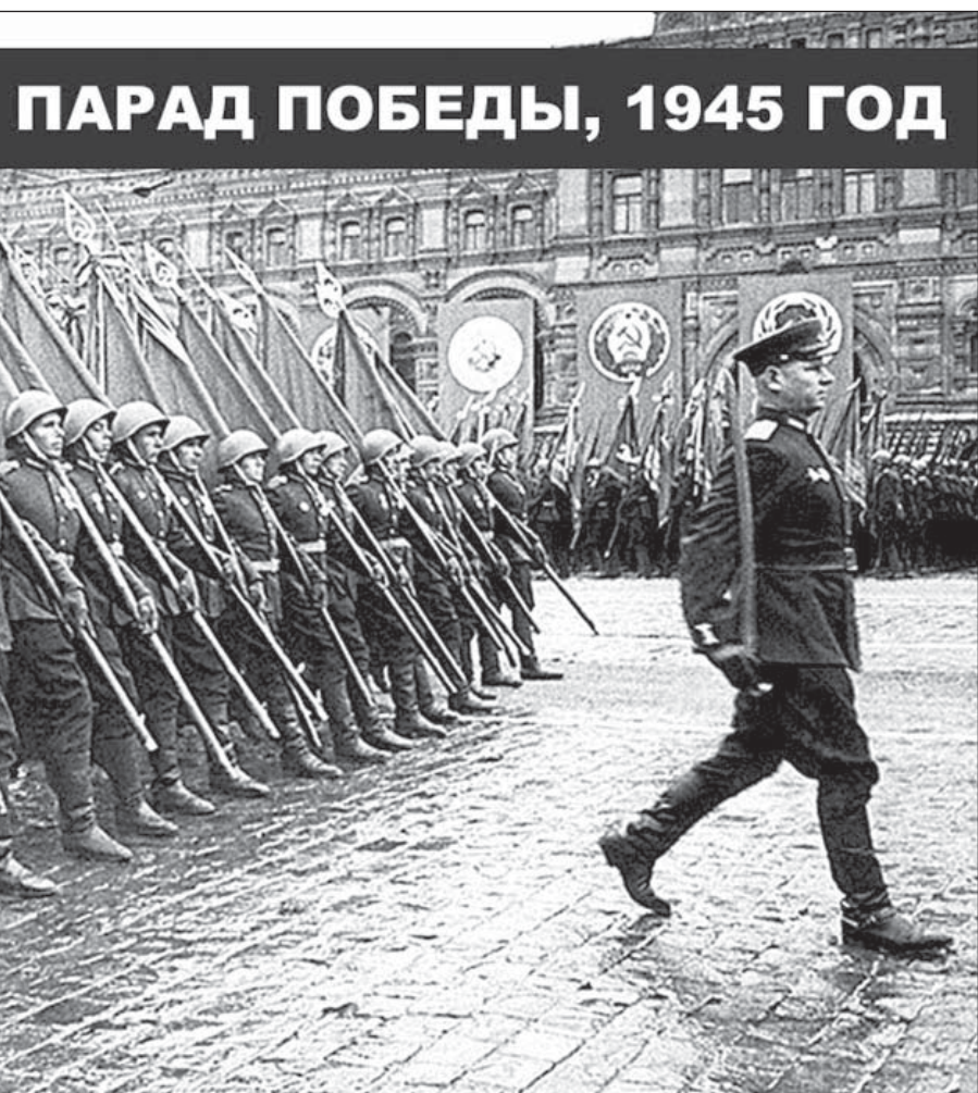
ПАРАД ПОБЕДЫ, 1945 ГОД

...ский подвиг народа. День Победы мы отмечаем как ...ть павшим в боях! Слава победителям!