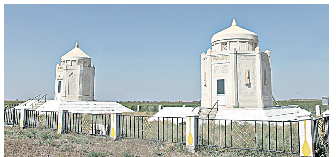
Мәмен мен Тұяқберді күйші кесенесі