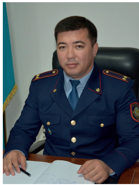
ойнап жүрмін. Спортты тастаған емеспін. Барлығы өзім үшін.

– Бұрынырақ еркін күреспен шұғылданғанмын. Кейіннен бәсеінде суға жүзумен айналыстым, фитнеске бардым. Арасында көкпар шауып тұрамын. Салым салған кездерім де болып тұрады. Қазір өзімізге белгіленген спорт күндері футбол