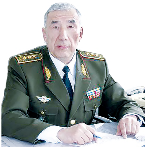
Каирбек СУЛЕЙМЕНОВ, министр внутренних дел РК (1995-2000 гг., 2002-2003 гг.) генерал-полковник