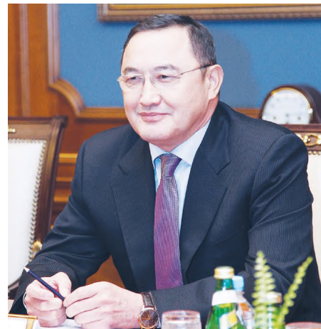
Заутбек ТУРИСБЕКОВ, первый зам. председателя Всемирной ассоциации казахов, министр внутренних дел РК (2003-2005 гг.)

Поздравляю ветеранов и всех сотрудников органов внутренних дел с профессиональным праздником, желаю благополучия и успехов в благородном деле!